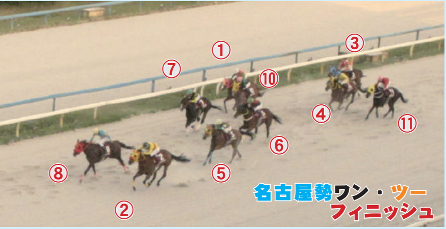
名古屋勢ワン・ツーフィニッシュ