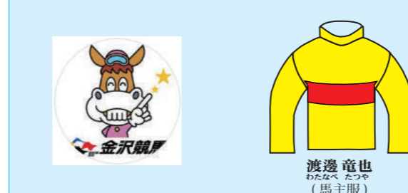
渡邊 竜也 (馬主服)