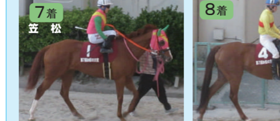
④コパノフランシス 菅原厩舎