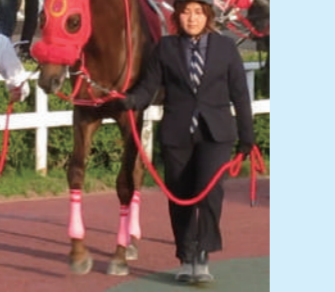
⑥ジュンノールック 中川厩舎