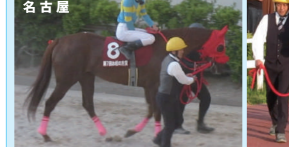
⑧エレインアステイ 今津博厩舎