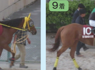
⑨エイシンコンソテ 笹野博厩舎