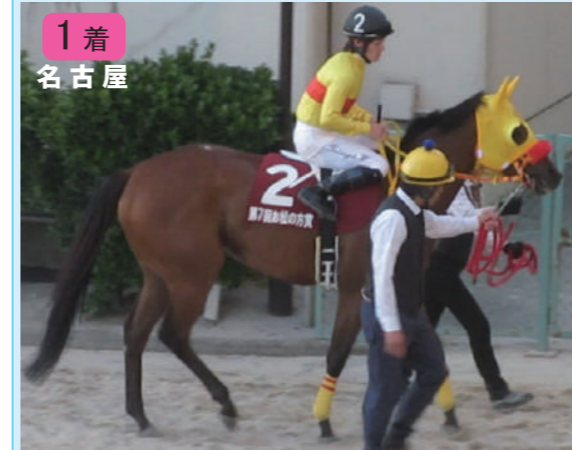
②コパノエミリア 宇都厩舎