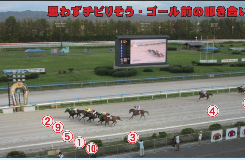
思わずチビリそう・ゴール前の叩き合い