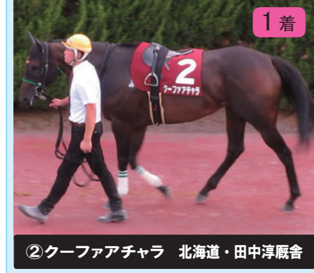
1着 ②クーファアチャラ 北海道・田中淳厩舎