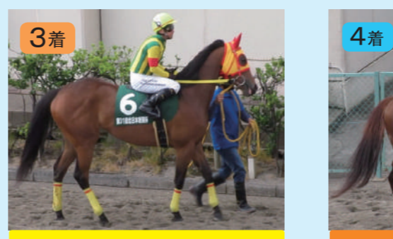
⑥スカイピース 中川厩舎