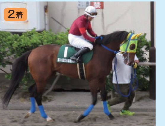
①ポストンコモン 高橋俊厩舎