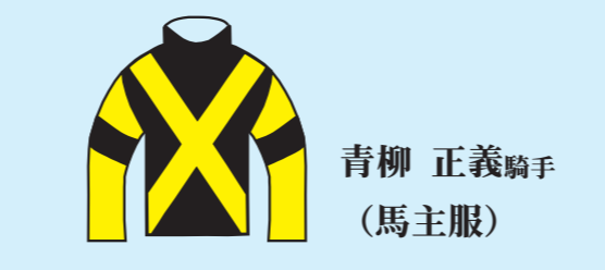
青柳 正義騎手 (馬主服)