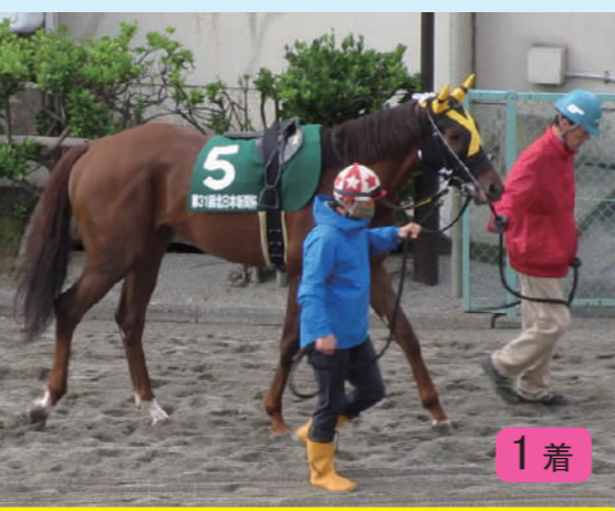
⑤ノブノビスケッツ 加藤和厩舎