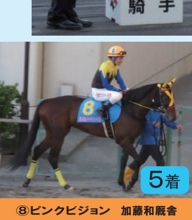
⑧ピンクビジョン 加藤和厩舎