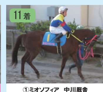
⑪ミオソフィア 中川厩舎