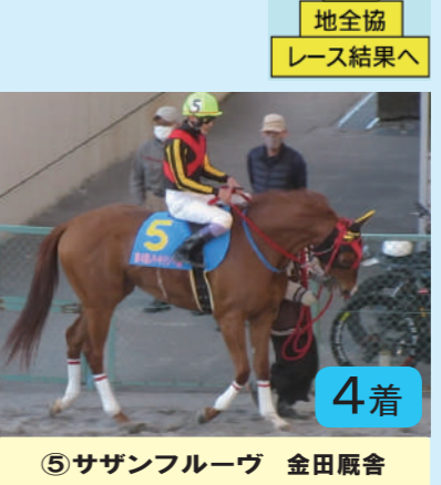
⑤サザンフルーヴ 金田厩舎