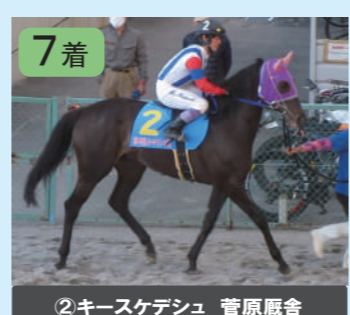
⑦ソルレバンテ 中川厩舎