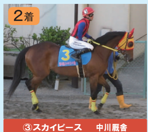
③スカイピース 中川厩舎