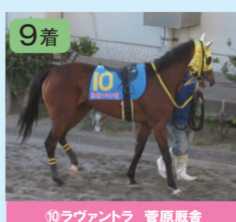
⑥カノンチャン 金田厩舎