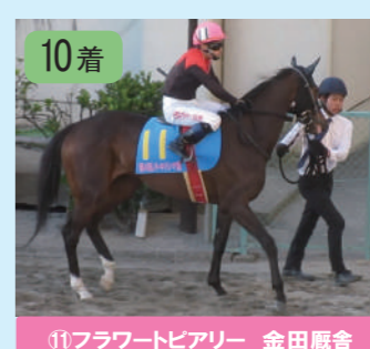
⑩ラヴァントラ 菅原厩舎